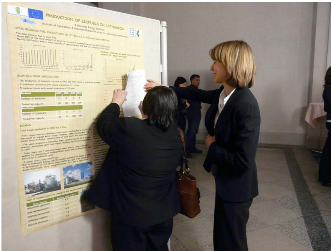
Seminaro dalyviai domisi Lietuvos plakatu